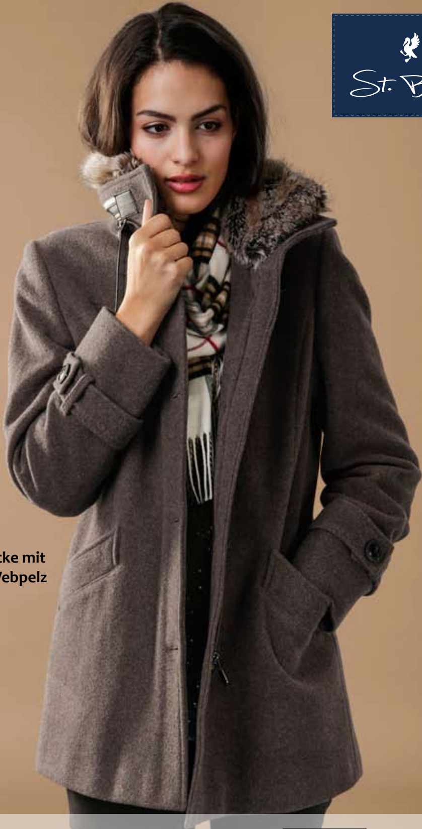
Elegante Wolljacke mit abnehmbaren Webpelz € 149,95