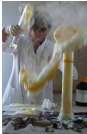
Auf dieses Ereignis warteten die Kinder in größter Spannung

Daran nahmen insgesamt 34 Kinder aus Bad Hall und Pfarrkirchen teil. Mit großer Freude rührten, pipetierten sie Reagenzien. Mit großer Geduld gab es von der Chemikerin leicht verständliche Antworten auf die unzähligen Fragen der jungen Forscher.