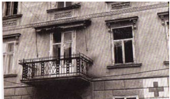
In der Broschüre „100 Jahre Rotes Kreuz Bad Hall“ befindet sich das Bild des „Hotel Posts 1945“ mit dem grauen Tarnanstrich und dem Roten Kreuz

Derzeit sucht das Museumsteam noch Bilder oder Dokumente aus ehemaligen Bad Haller Lazaretten und Krankenhäusern. Meldungen dazu werden an Obmann Peter Kerbl oder Mag. Katharina Ulbrich erbeten.