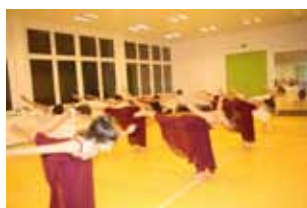
Der Körper im Einklang mit der Musik und der Gruppe

Pilates - Körpertraining -Mi, 19:20 u. Do, 08:30 Uhr