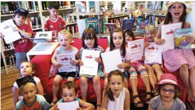
Für die eifrige Gruppe des Kindergartens gab es den Büchereiführerschein.

Auch heuer begleitet die Kinder wieder „Balduin der Bücherwurm“ durch den Sommer. Für jedes entlehnte Buch gibt es einen Stempel in den Bücherwurmpass und damit die Chance auf tolle Buchpreisgewinne.