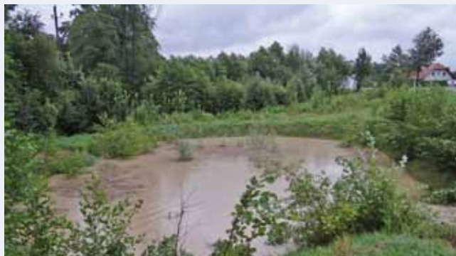
Das Retentionsbecken „St. Blasien“ Fassungsvermögen ca. 790 m 3 ;

Becken hat sich fast vollständig gefüllt, die nachfolgende Entleerung erstreckte sich über einen Zeitraum von mehr als 12 Stunden. Mit dieser Regenwasseranlage wird der Blasen- oder Thannschachnerbach bei Starkregenereignissen hinsichtlich Abflussverhalten entsprechend entlastet.