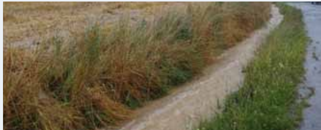
Der Entwässerungsgraben „Am Südhang“

Die Klimaveränderung verursacht eine Zunahme von lokalen Starkregenereignissen mit dem Ergebnis von enormen Schäden. Technische Maßnahmen zur Abwehr gegen Überflutungen haben natürlich auch ihre Grenzen. Außerordentliche Katastrophenfälle können allenfalls gemildert aber nicht verhindert werden.