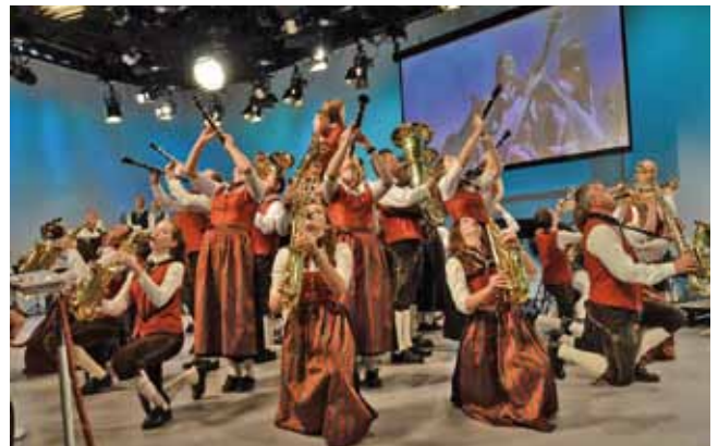
Die Musikerblüte als Abschluss der Marschshow im ORF Landesstudio

Die Musikerinnen und Musiker, danken allen, die ihnen bei den Abstimmungen ihre Stimme gegeben haben.