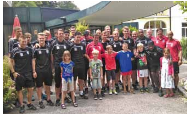
Der LASK mit dem Bad Haller Fußballnachwuchs

Daher tankten auch die „11er“ von Red Bull Salzburg Kraft und Energie im Hotel Miraverde, bevor Sie am 15. Juli zum ÖFB-CUP Spiel gegen SK Vorwärts Steyr antraten.