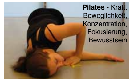
Pilates - Kraft, Beweglichkeit, Konzentration, Fokussierung, Bewusstsein