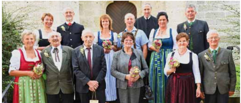
Die Jubelpaare nach dem feierlichen Gottesdienst in der Pfarr- und Wallfahrtskirche Adlwang