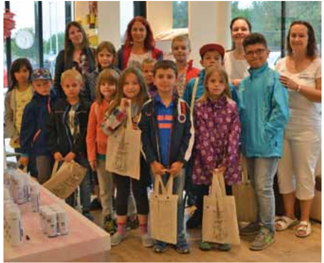
Eine Hort-Gruppe nach Abschluss des Besuches in der Marienlieb Apotheke.

Nach reichlichem Genuss von selbstgebackenem Schokokuchen gab es als Erinnerung noch ein kleines Geschenk von der Apotheke.