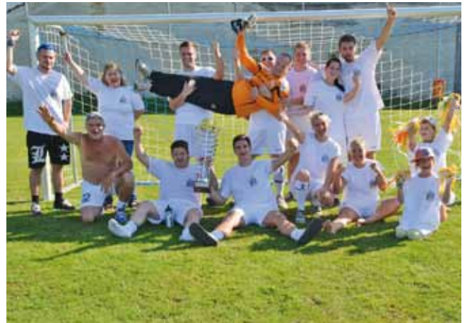
Ihr Einsatz hat sich gelohnt. Der Pokalgewinn wurde erfolgreich verteidigt!

ner/innen der Heime verfolgten mit Begeisterung das Spiel und feuerten ihre Mannschaft mit selbstgebastelten Fanartikeln an. Die Spieler gaben trotz der Hitze ihr Bestes und boten eine starke Leistung. Das Spiel endete mit einem 2:1 Sieg für das SWH Schloss Hall, welches damit zum zweiten Mal den Pokal nach Hause holte. Im Anschluss feierten beide Mannschaften bei einer Jause und Getränken im Bezirks seniorenheim.