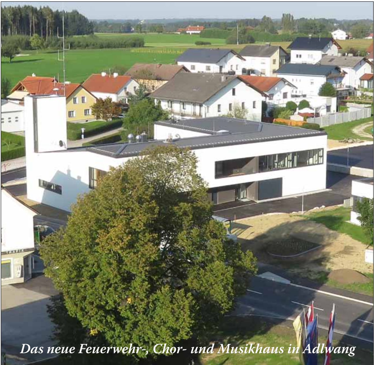
Das neue Feuerwehr-, Chor- und Musikhaus in Adlwang