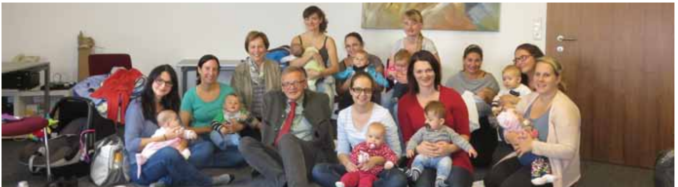
Der erste Adlwanger Babytreff war ein voller Erfolg!

Der Adlwanger Babytreff findet alle 14 Tage dienstags von 10:00 bis 11:00 Uhr im Sitzungssaal des Gemeindeamtes Adlwang statt. Ein kleiner Unkostenbeitrag von € 1,50 wird pro Termin eingehoben.