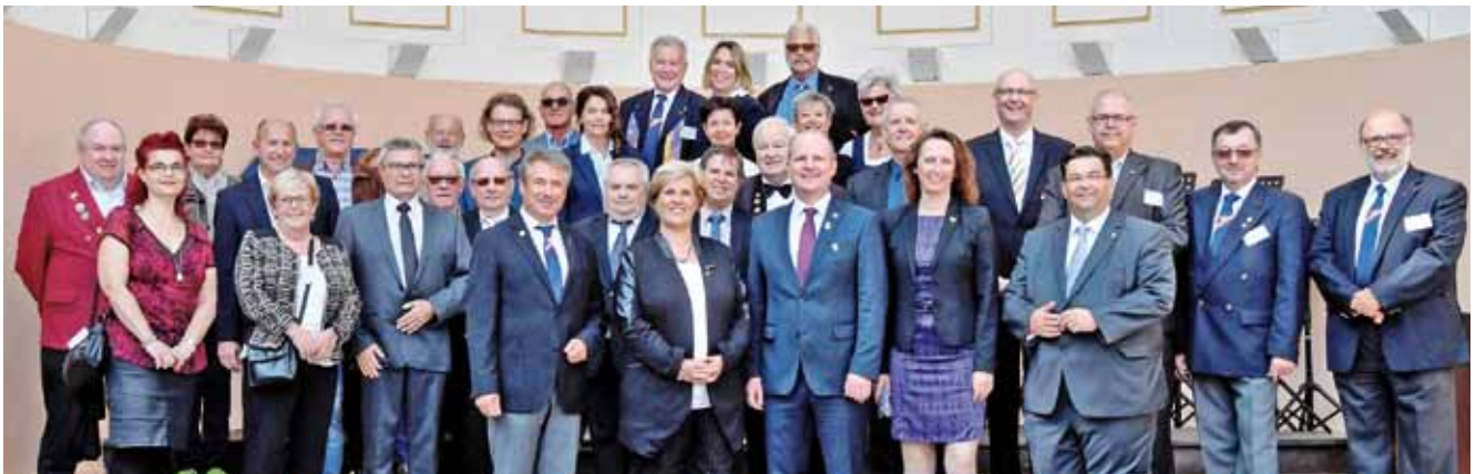
Die Vertreter und Delegierten der Außenbeauftragten-Konferenz der NÄrrischen Europäischen Gemeinschaft.

Erstmals wurde gemeinsam bei einer Weinprobe der Jahreswein der NÄrrischen Europäischen Gemeinschaft verkostet und ausgewählt.