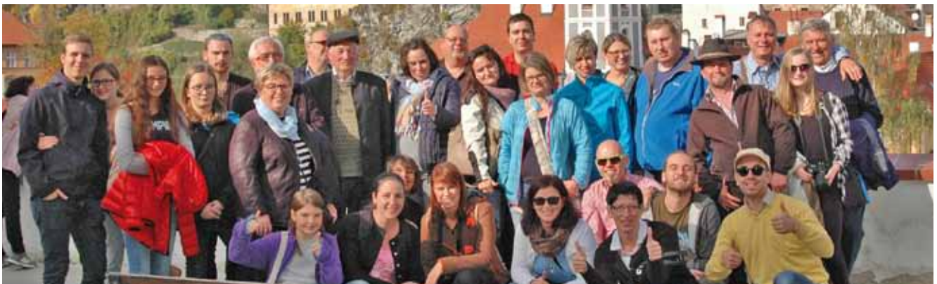
Kameradschaft und Gemeinschaftspflege quer durch alle Altersschichten zeichnen die Stadtkapelle aus.

Die Ausflugsfahrt fand in geselliger Runde in der Freistädter Brauerei ihren Abschluss.