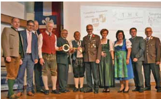
Die feierliche Schlüsselübergabe erfolgte im Rahmen eines Festaktes in der Bürgerhalle Adlwang.

Die Segnung und Übergabe fand am 25. September statt. Neben der Bevölkerung, der Freiwilligen Feuerwehr und den Vereinen nahmen auch zahlreiche Ehrengäste daran teil. In ihren Grußworten brachten sie ihre Freude über den überaus gelungenen Neubau zum Ausdruck.