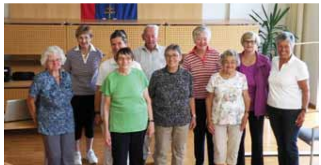
Die Kursteilnehmer von „Trittsicher und mobil auch im Alter“

hofer für die Ausrichtung und professionelle Begleitung des Kurses.