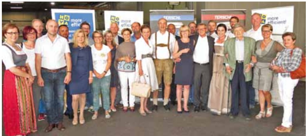
Die Teilnehmer am ersten Sommerabend-Empfang für Adlwanger Unternehmerinnen und Unternehmer.