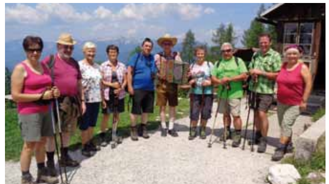
Naturfreunde-Wanderhit „Gowilalm-Holzerkar“ im Juni 2017

Die Voranmeldung ermöglicht, organisatorisch auf Wettervorhersagen zu reagieren und entsprechend den Ausfahrtstermin in Absprache mit den Interessenten zu verlegen.