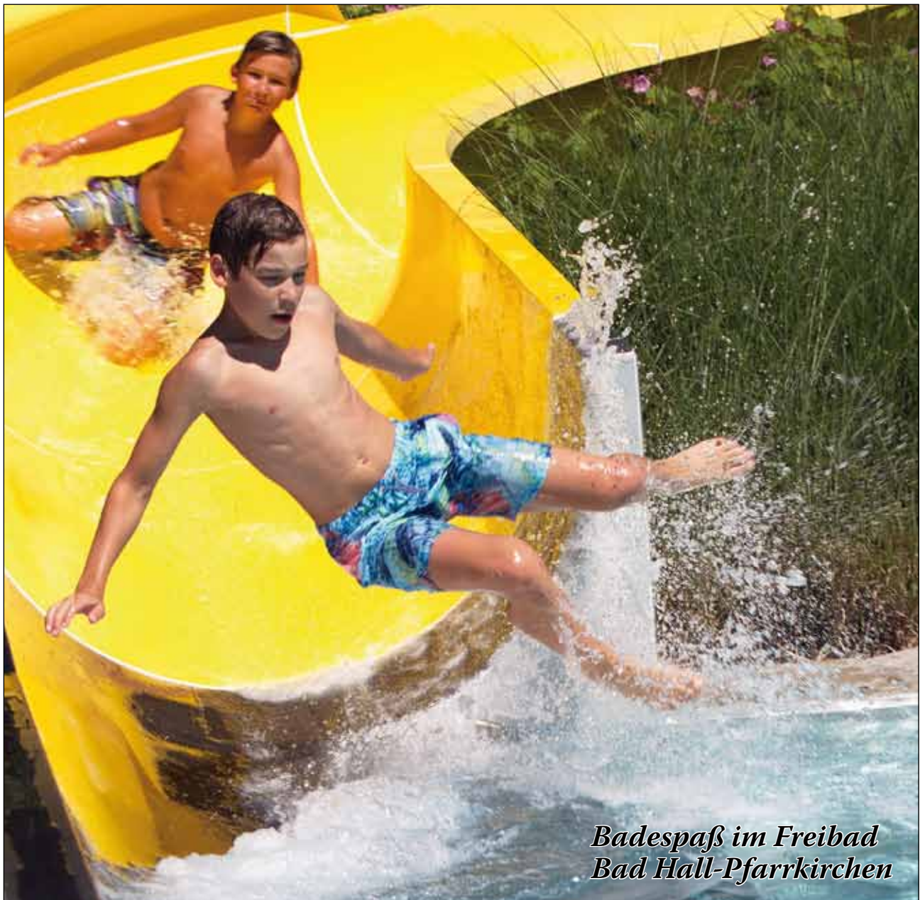
Badespaß im Freibad Bad Hall-Pfarrkirchen