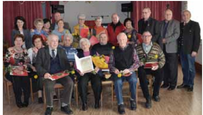
Für ihre langjährige Mitgliedschaft zum Pensionistenverband wurden 24 Mitglieder geehrt