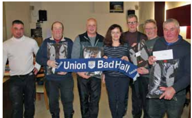
Die „Stoanis“ sind die neuen Stadtmeister im Eisstockschießen.