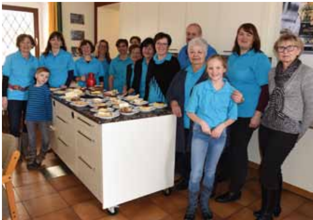
Mit selbstgebackenen Mehlspeisen verwöhnte das Bibliotheksteam die Gäste beim Pfarrkaffee.

Das Bibliotheksteam dankt den Besuchern für die großzügigen Spenden, denn diese sind auch eine Form der Anerkennung der ehrenamtlichen Arbeit der Bibliothekarinnen und Bibliothekare.