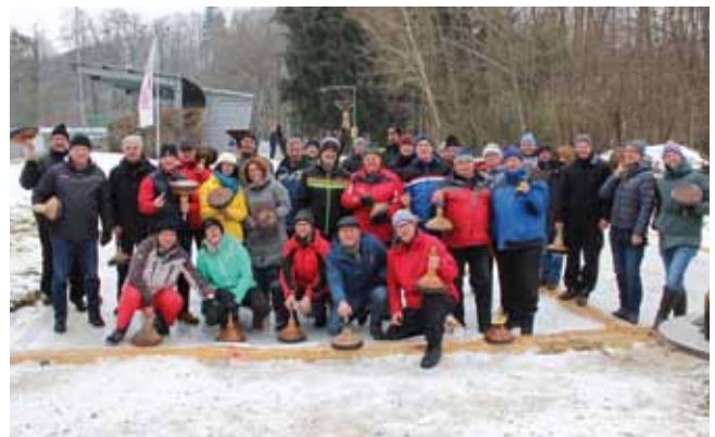
27 Moarschaften kämpften um den Stadtmeistertitel.