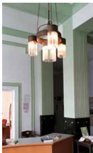
Der neue Jugendstil-Luster im Eingangsbereich

Übrigens: Am Donnerstag, 5. April öffnet das Museum im Forum Hall für die Saison 2018.