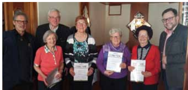
Ehrung langjähriger Mitglieder bei der Jahreshauptversammlung

Bei der Jahreshauptversammlung Anfang März wurden einige langjährige Mitglieder geehrt.