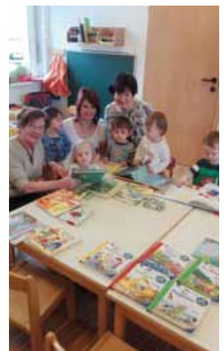
Die mobile Bibliothek sorgt für strahlende Kinderaugen.

„Die strahlenden Kinderaugen und die erwartungsvollen Blicke sind der beste Beweis, dass man den Kindern mit Büchern große Freude und Lust aufs Lesen machen kann, der damit verbundene Zeitaufwand lohnt sich“, berichten die beiden Bibliotheksmitarbeiterinnen nach ihrem Besuch im Montessori-Kinderhaus.