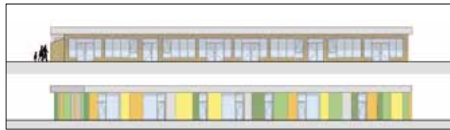
Planansicht vom Hort

Die beiden Gebäude werden noch in diesem Jahr am bisherigen Standort in Holzbauweise errichtet. Geplante Kosten 4.000.000,-. Das alte Gebäude wird abgerissen. Einen ausführlichen Projektbericht gibt es in der nächsten Ausgabe.