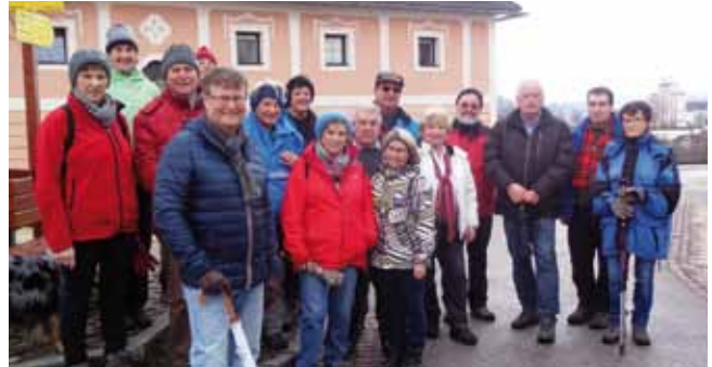
Die Wanderhit-Teilnehmer im Februar in Kirchberg, Kremsmünster.