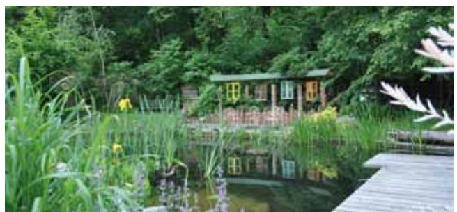
Entdecken Sie die Geheimnisse in Johannas Zaubergarten: die Blütenpracht der Blumen, „essbare Zonen“ und malerische Teichlandschaften.

In Johannas Zaubergarten gibt es für die Besucher an diesen beiden Tagen auch kulinarische Häppchen (Palatschinken-Variationen) und eine Weinverkostung.