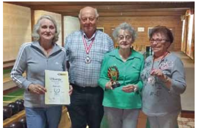
Silber bei der Bezirkskegelmeisterschaft

Alle Mitglieder sind dazu herzlich eingeladen, um gemeinsam mit den Ehrengästen dieses mitzufeiern.