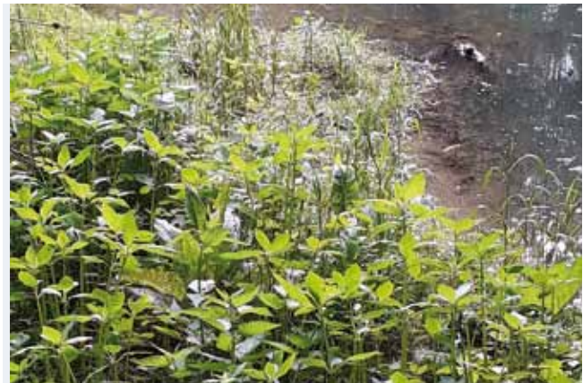
Indisches Springkraut am Sulzbach

Speziell beim Japanischen Knöterich muss man bei der Entsorgung einiges beachten. Herkömmliches Kompostieren fördert eher seine Ausbreitung, er sollte thermisch vernichtet werden. Manche Bäume, wie der Götterbaum oder die Robinie, müssen „geringelt“ werden, damit man sie nachhaltig entfernen kann.