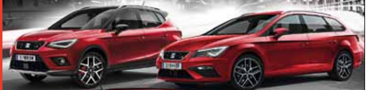
Der SEAT Leon ST Kombi