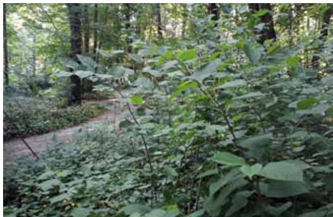
Japanischer Knöterich am Sulzbach