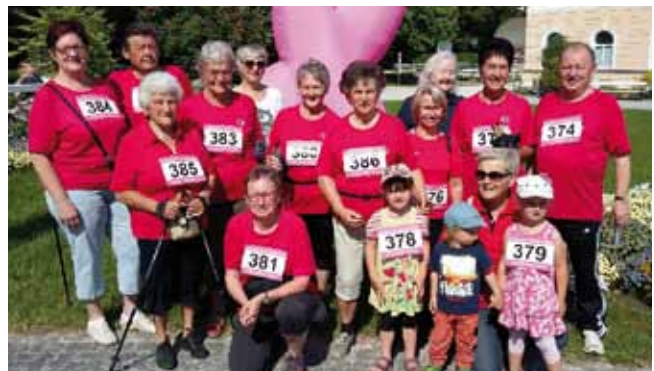
Auch heuer nahm eine Abordnung der Bad Haller Pensionisten am Pink Ribbon Charity Lauf für Brustgesundheits am 12. Mai teil.

WAPO unterhielt mit musikalischen Darbietungen, musikalisch begleitet von seiner Gattin.