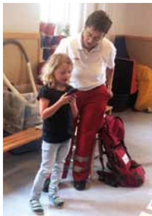
Den Notruf 144 wählen und Hilfe anfordern.

So wie die Kleinen sollten auch die Großen immer wieder ihre Erste Hilfe-Kenntnisse auffrischen.