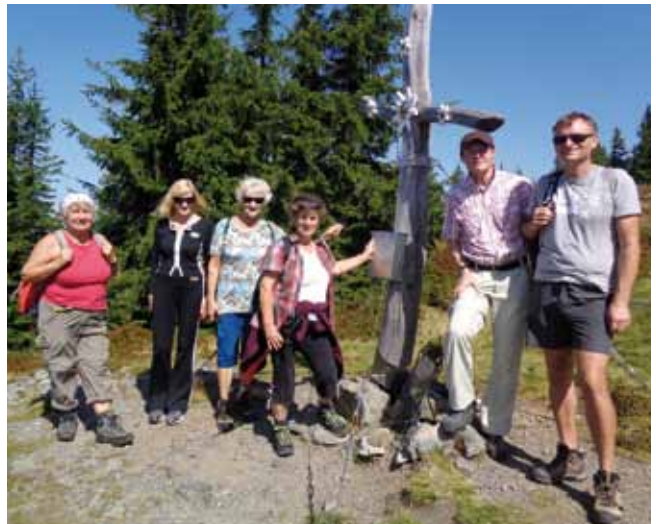
Die Naturfreunde Wanderer am Lahngangkogel, 1778 m.