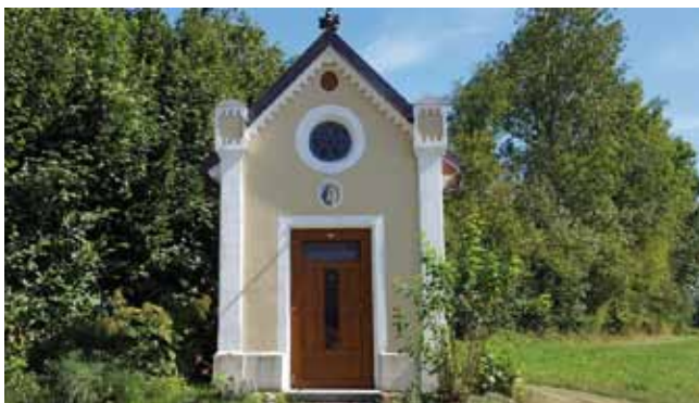
In schönster Pracht die neugotische Kapelle bei der Aumühle und die renovierungsbedürftige Auhuberkapelle in unmittelbarer Nachbarschaft, die an ein Gewaltverbrechen im Jahr 1862 erinnert.