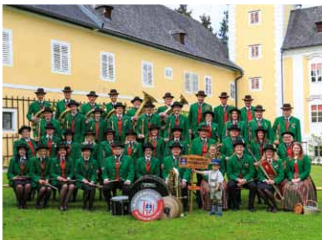
Die Musikkapelle mit 51 aktiven Musikerinnen und Musikern im Jubiläumsjahr.