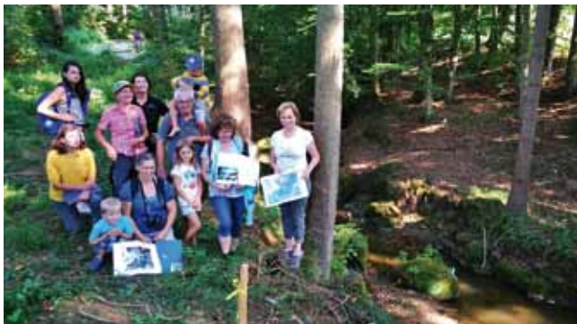
Hallerwald-Runde 1 mit Kugelsteinen