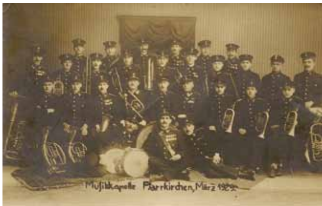
Die Pfarrkirchner Musikkapelle im März 1929.