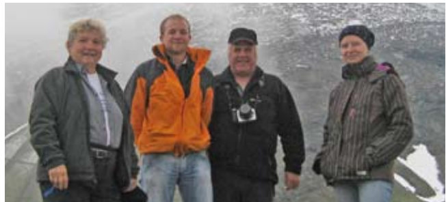
Am Mooserboden in Kaprun.

Trotz Schneefall im Frühsommer ließ sich eine kleine Naturfreunde-gruppe nicht davon abhalten die Sonnenwende auf der Höhenburg am Mooserboden in Kaprun zu feiern und dabei die Gastfreundschaft der Hochgebirgsschule der Naturfreunde zu genießen.