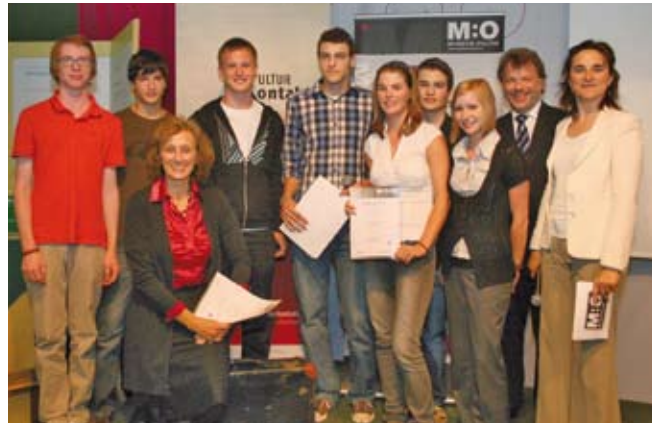
Urkundenübergabe an die Schüler der HAK und HLW Steyr durch Vertreter des Unterrichtsministeriums (rechts)