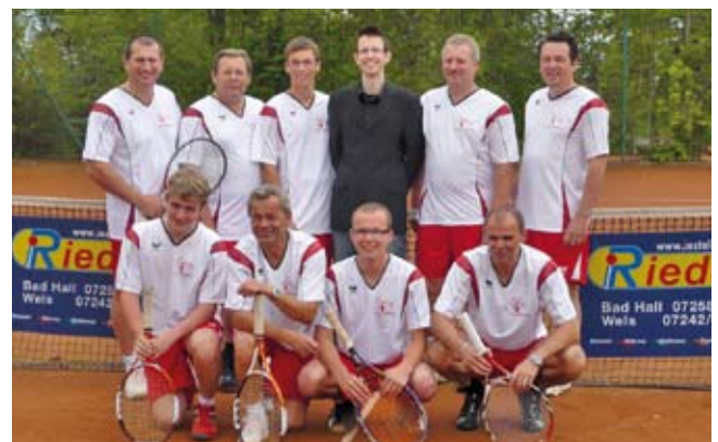
Die siegreiche Herrenmannschaft in den neuen Dressen.