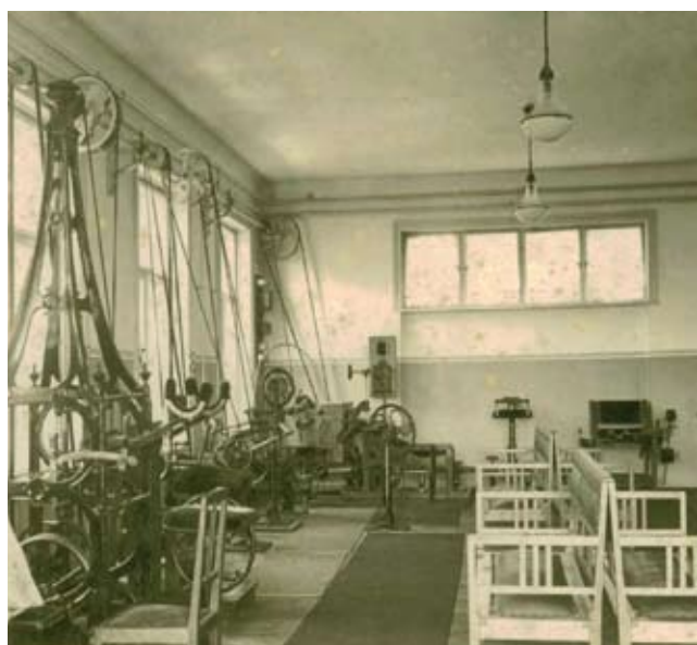
Das 1. Fitness- und Belastungszentrum von Bad Hall war im „Sanatorium“ ab 1907.