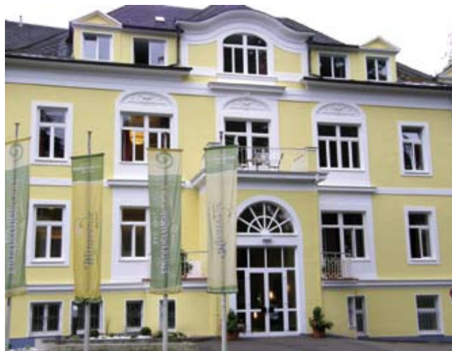
Heute ein Juwel der Bäderarchitektur: Hotel Miraverde

Nach dem Ersten Weltkrieg fand jedoch ein völliger Zusammenbruch des Kurtourismus in Bad Hall statt. Das Land