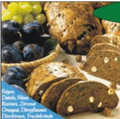
Feigen, Datteln, Nüsse, Rosinen, Zitronat, Orangenzit., Dörreflammen, Dörrobst, Fruchtbrände

Guten Appetit wünscht Ihnen der Bad Haller Bauernmarkt