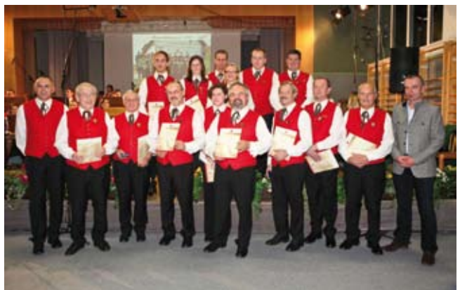
Die geehrten Musikerinnen und Musiker.