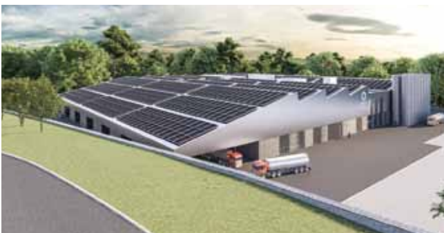
Solarpaneele sorgen für Nachhaltigkeit. Die Eröffnung ist für Anfang 2023 geplant.