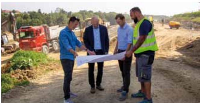
Baubesprechung am Gelände mit Architekt, Bauherrn und Baufirma.

Auch an die Mitarbeiter wurde gedacht. Eine speziell gekühlte und überdachte Eisstockbahn wird im Winter für Spaß und Abwechslung bei der Belegschaft sorgen.