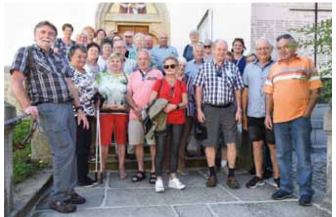
Die Adlwanger Pensionisten genossen die erste Ausflugsfahrt ins Mühlviertel.

Überaus interessant war die Führung durch den