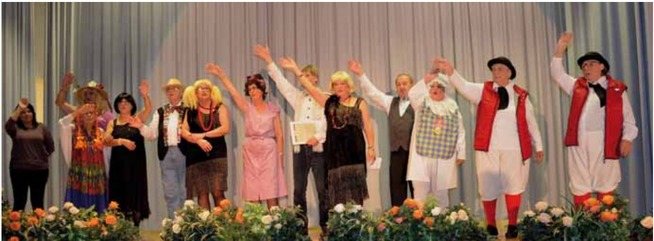
Der Pensionistenchor, die „Herbst-Zeitlosen“ aus Pfarrkirchen begeisterte die Gäste.

Voraussichtlich im nächsten Jahr werden die „Herbst-Zeitlosen“ wieder auf der Bühne stehen.