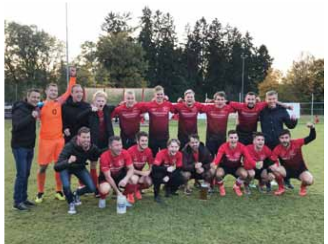
Die Union HOVA Adlwang krönte sich zum Herbstmeister 2021.

Gute Nachrichten gibt es seitens der Gemeinde: Die Errichtung der neuen Bewässerungsanlage kann in Angriff genommen werden. Dadurch soll in der kommenden Saison eine Top Rasenqualität garantiert werden.