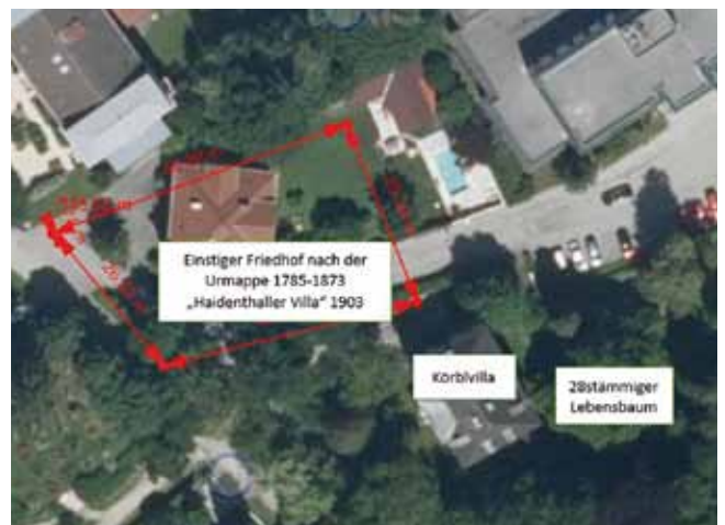
Karten-Overlay von DORIS.ooe.gv.at.