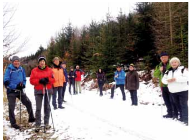
Die Naturfreunde-Wanderguppe am Gruabholzweg in Oberschlierbach.

Informationen, oder falls etwa witterungsbedingt Termine verlegt werden. Startpunkt für die Fahrgemeinschaften ist jeweils der Parkplatz im Ortszentrum von Pfarrkirchen.