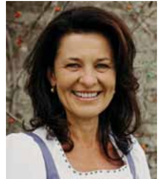
Liebe Pfarrkirchnerinnen, liebe Pfarrkirchner!

Die gesamte Stellenausschreibung finden Sie auf der Website der Gemeinde Pfarrkirchen bei Bad Hall: www.pfarrkirchen-badhall.at .