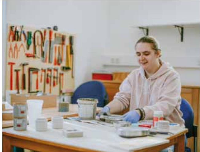
Die Werkstätten des Diakoniewerks in Bad Hall, Linz-Stifterstraße und Hagenberg wurden mit dem Gütesiegel für Betriebliche Gesundheitsförderung ausgezeichnet.