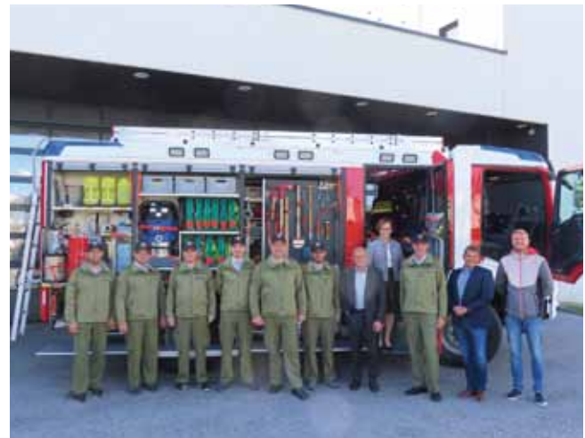
So wird das neue Löschfahrzeug aussehen.

Die Auslieferung erfolgt voraussichtlich Anfang 2023.