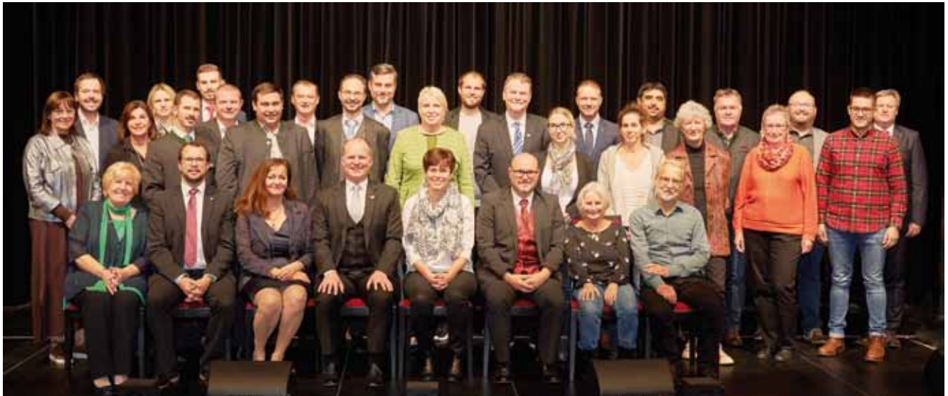
Der neue Bad Haller Gemeinderat nach der konstituierenden Sitzung.

Im Stadtrat hat die ÖVP 4 Sitze, die SPÖ, die Grünen und die Freiheitlichen je einen Sitz.