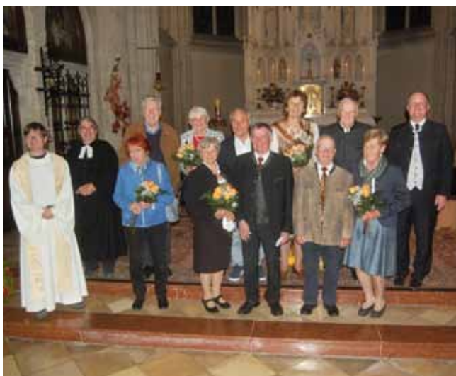
Die Goldenen und Diamantenen Jubelpaare.

Pfarre, Gemeinde und die Redaktion wünschen den Jubelpaaren alles Gute für den weiteren gemeinsamen Lebensweg.