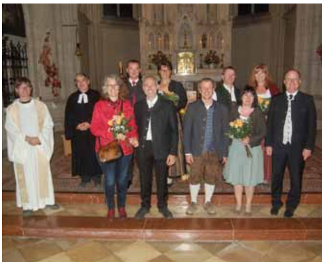
Die Silbernen Jubelpaare.