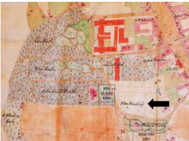
Der Ortsplan von 1891.