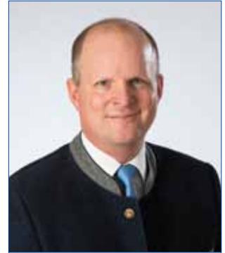
Liebe Bad Hallerinnen und Bad Haller

Nähere Auskünfte erteilt gerne die Baurechtsverwaltung des Kurbezirks Bad Hall am Stadtamt Bad Hall, Hauptplatz 5, Tel. 07258/7755-0.