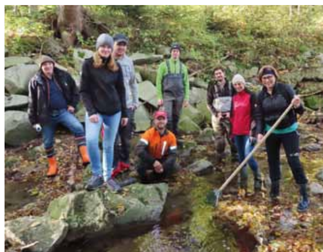
Auf den Spuren der Krebse - Begehung des Sulzbachtales