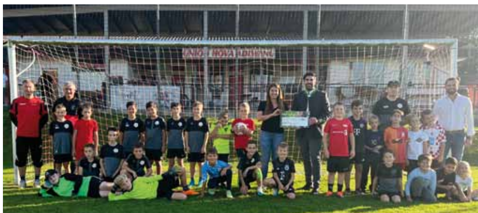
VMM Versicherungsmakler Mitter GmbH übergab einen Spendenscheck

Aktuell wird bereits die Herbstsaison im Fußball gespielt, bei der sieben Nachwuchsteams gestellt werden.