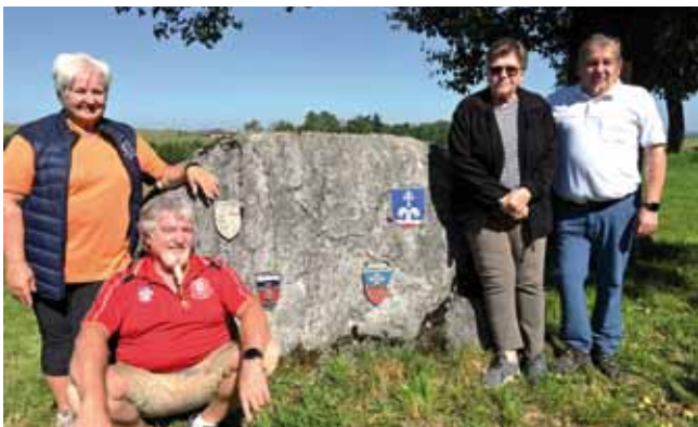
Am Vier-Gemeinden-Stein in Weißenbach

Bei den Bezirkswandertagen am 15. September in Steyr und am 21. September in Molln waren die Pfarrkirchner mit jeweils 9 Personen mit dabei.