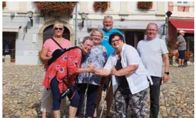
Entdeckungstour in Slowenien und sichtlich Spaß dabei