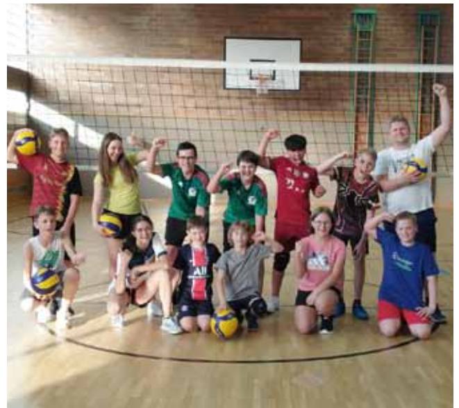
Die ambitionierte und erfolgreiche Volleyballjugend

Training Herren: Freitag, 19:00 – 21:00 Uhr (Meisterschaftstraining 3. Landesliga), Kontakt: Max Gruber (+43 676 96 639 16).