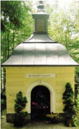
Der Heilige Brunnen

Die zweite Sage berichtet dass an einem Samstag ein Priester auf einem Versehgang mit dem Allerheiligsten an einer Wiese vorbeikam, auf der zwei Arbeiter mähten. Einer setzte seine Arbeit fort, der zweite begleitete den Priester. Als dieser zurückkam, fand er auf dem Feld einen goldenen Pfening zum Lohn für seine Andacht.