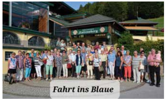
Die Pfarrkirchner Pensionisten am Zottensberg