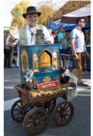
Auch einen Drehorgelspieler gab es zu hören und zu bestaunen