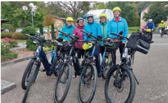
Biken trotz Nieselregen macht auch Freude