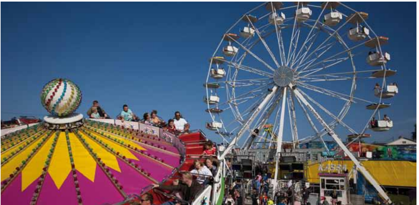
Reges Kirtags-treiben im Wallfahrtsort Adlwang.