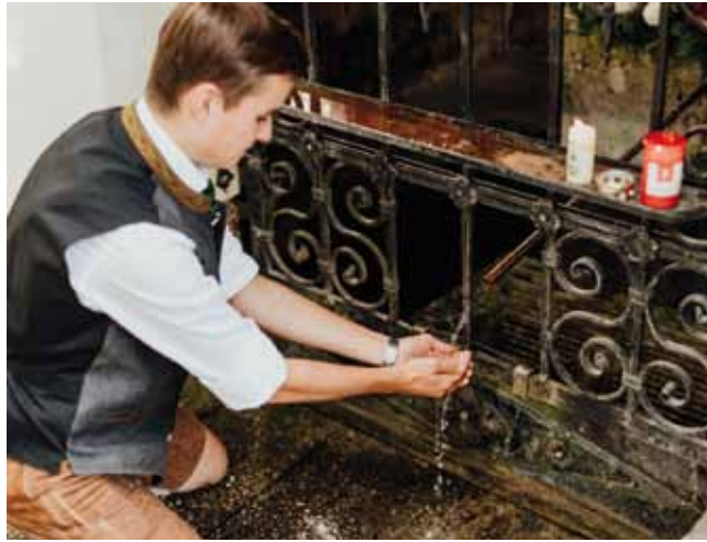
Augenwäsche beim Heiligen Brunnen