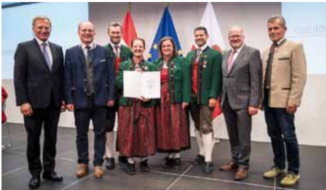
Der Musikverein Hilbern erhielt eine Ehrung für die besonderen Leistungen in der Stufe 2.

Dafür und für die großartige musikalische Arbeit ein herzliches Dankeschön.“