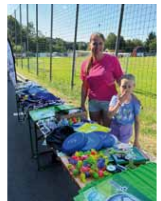
Jedes Kind erhielt ein kleines Willkommensgeschenk