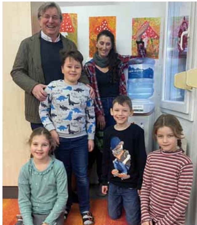
Der Lions Club finanziert Trinkwasser für die 3. und 4. Klasse

Das gesamte Schuljahr 2023/24 wird die Wasserversorgung durch den Lions Club finanziert.