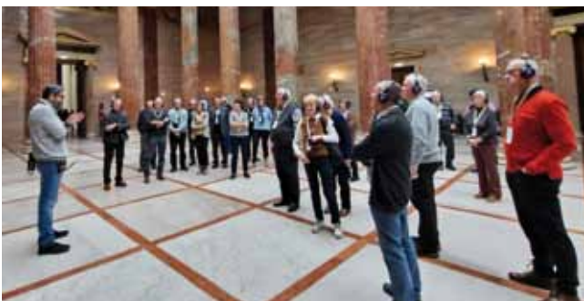
Eindrucksvolle Besichtigung des Parlamentes

bei gab es viel Interessantes und Unterhaltsames über die Geschichte und die Renovierung des Hauses zu erfahren. Nach dem Mittagessen im Waldviertlerhof stand der Besuch des Weihnachtsmarktes vor dem Schloss Schönbrunn am Programm. Dies war ein stimmungsvoller Abschluss des von Reiseleiter Alfred Pramhas bestens organisierten Ausfluges.