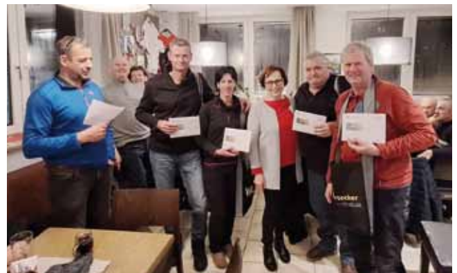
3. Platz: Holzinger's