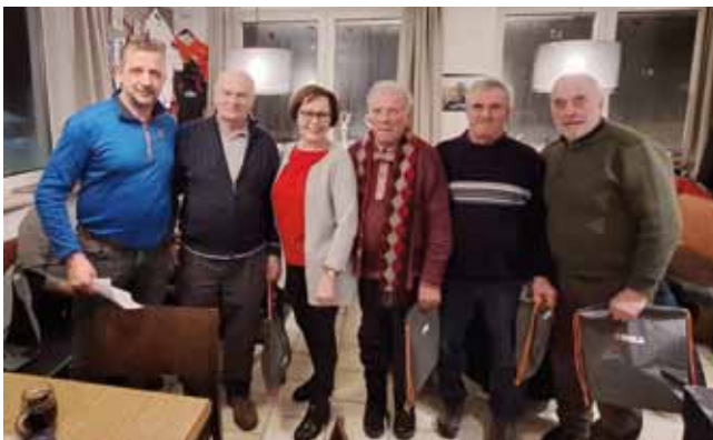
2. Platz: Seniorenbund