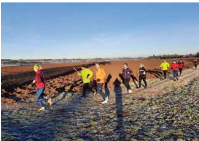
Dem Sonnenaufgang entgegen

Bei der „Adventhaltestelle“ wurden Heißgetränke, Kekse und Würstel für die Läufer und die Anwesenden gegen freiwillige Spenden angeboten. Der Erlös daraus wurde „Licht ins Dunkel“ gespendet.