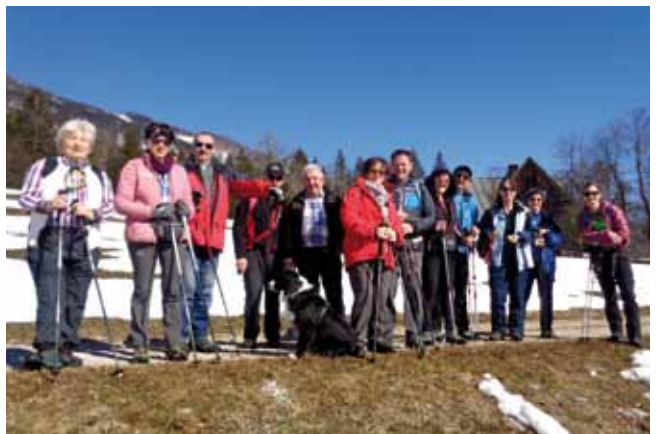
Die Teilnehmer an der Wanderhit Öttl-Runde in Hinterstoder

mer, 0676/54 189 21 oder Annemarie Rampetsreiter, 0681/10 450 236, nehmen gerne Anmeldungen entgegen und geben weitere Informationen, oder falls etwa witterungsbedingt Termine verlegt werden.