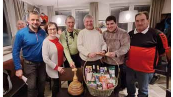
Ortsmeister 2024: SPÖ

zogen bei der Siegerehrung positive Bilanz über die Meisterschaft.