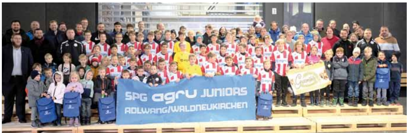
Die Spielgemeinschaft AGRU Juniors: Bambini bis U 15