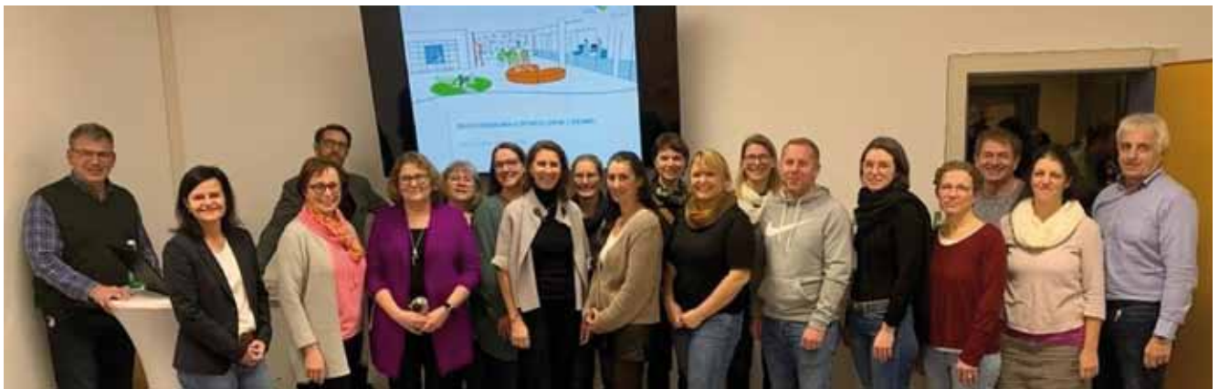
Die Teilnehmer am Impulsvortrag „Neue (Denk-)Räume“

Es mag jetzt sicherlich der eine oder andere Leser denken: „Da träumt jemand vor sich hin.“ Vielleicht? Aber was, wenn jemand mutig genug ist, groß und zukunftsfit zu denken?