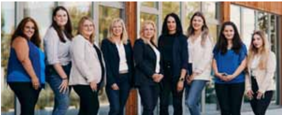
Am neuen Standort stehen dem Team moderne nachhaltige Arbeitsplätze zur Verfügung

Von Dokumente einsehen, Terminverwaltung, Daten-Vorerfassung für Buchhaltung und Personalverrechnung, Datenaustausch über die Datenbox bis hin zum Lohnsetportal je Dienstnehmer und vieles mehr ist möglich. Kommen Sie zu uns, wir informieren Sie gerne!