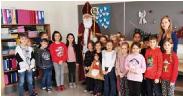
Der Nikolaus in der 1B Klasse

Bevor der Nikolaus wieder weiterzog, überreichte er den Schülerinnen und Schülern ein Sack gefüllt mit Nüssen, Äpfeln und Schokolade. Im Sinne des Teilens wurden die Gaben dann in der Gruppe gerecht unter allen Kindern aufgeteilt.