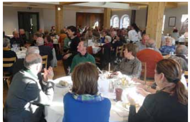
Weihnachtsfeier im Zeiliger-Gut