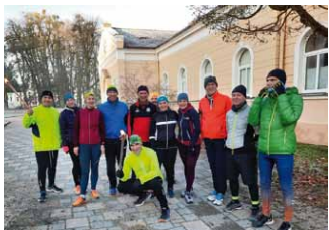
Die Adlwanger Läufer in Bad Hall