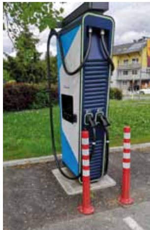
Die Schnellladestation beim Stadttheater

kann nach Registrierung und Einschulung kostengünstig bei Bedarf genutzt werden.