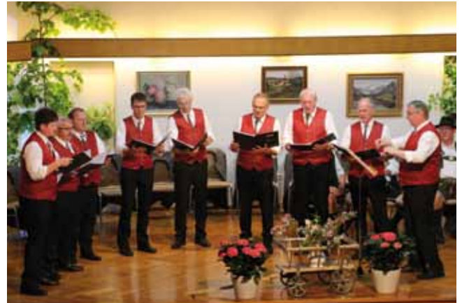
Die Sängerrunde bot ein abwechslungsreiches Programm