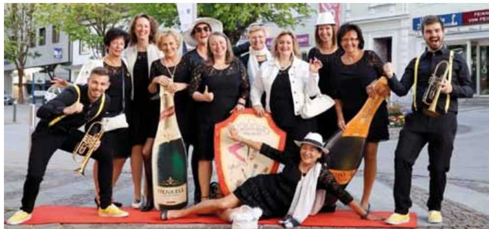
Das Schminkteam des BHCC feierte den Saisonabschluss