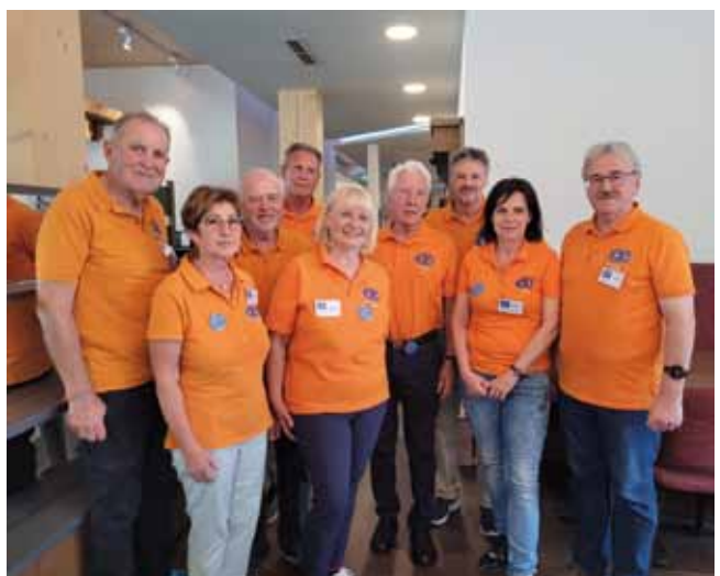
Der Computer Club Bad Hall feierte Jubiläum