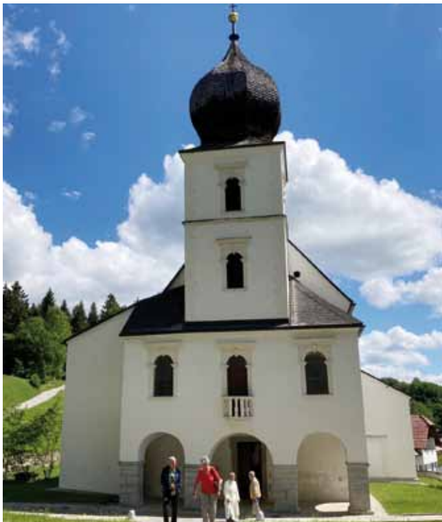
Die Wallfahrtskirche St. Wolfgang am Stein im Mühlviertel