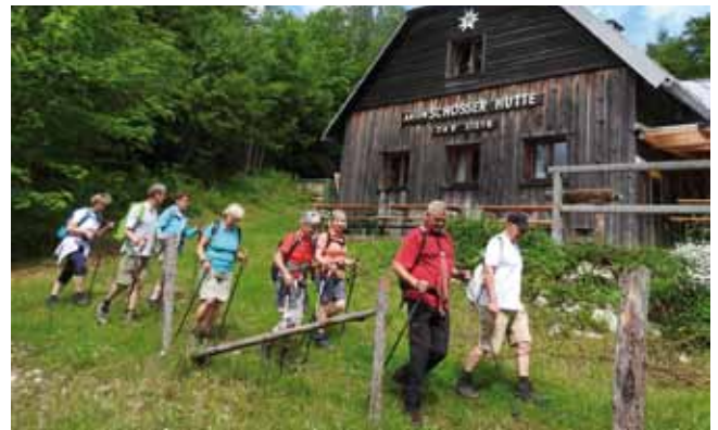
Vorbei an der Anton-Schösser-Hütte zur Hohen Dirn.

die herrliche Bergwelt des Nationalparks Kalkalpen belohnt. Ein malerischer Waldweg führte die Wandergruppe entlang des Sonnkogelgrats weiter zur Anton-Schösser-Hütte und von dort in kurzer Wegstrecke zum Gipfelkreuz der Hohen Dirn (1134m).