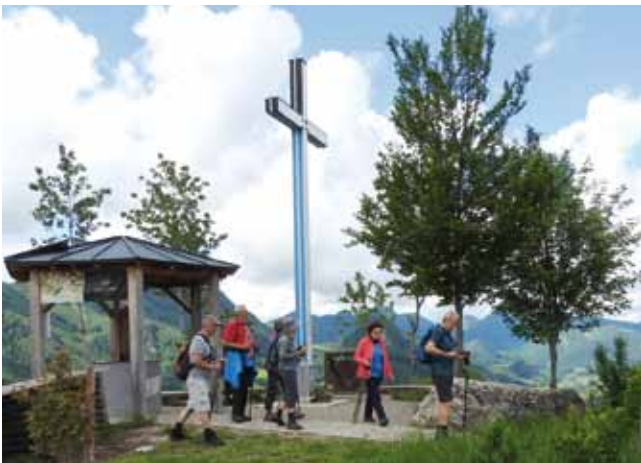
Auf der Ramlerhöhe mit dem Licht- und Liebeskreuz.

Der Anstieg zur Ramlerhöhe mit dem Licht-