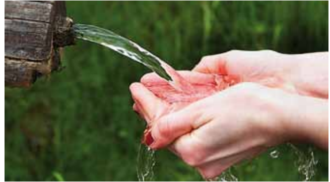
Das Foto „Quelle“ von Gerhard Hütmeier