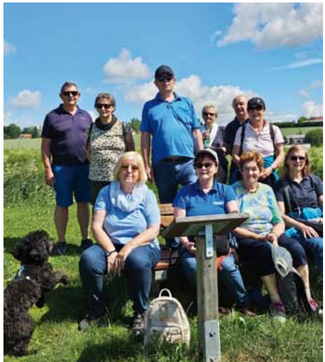
Kaiserwetter bei der Adalbert-Stifter-Wanderung

Die Muttertagsfeier beim Hametner und die Weinverkostung beim Seniorentreff im GH Heinz rundeten die Aktivitäten im Mai ab.