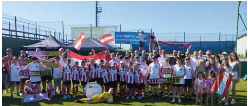
Die Nachwuchsmannschaft der SPG AGRU Juniors beim Turnier in Umag

Besonderen Dank an die vielen mitgereisten Eltern, die als Fanclub für tolle Stimmung am Platz sorgten.“